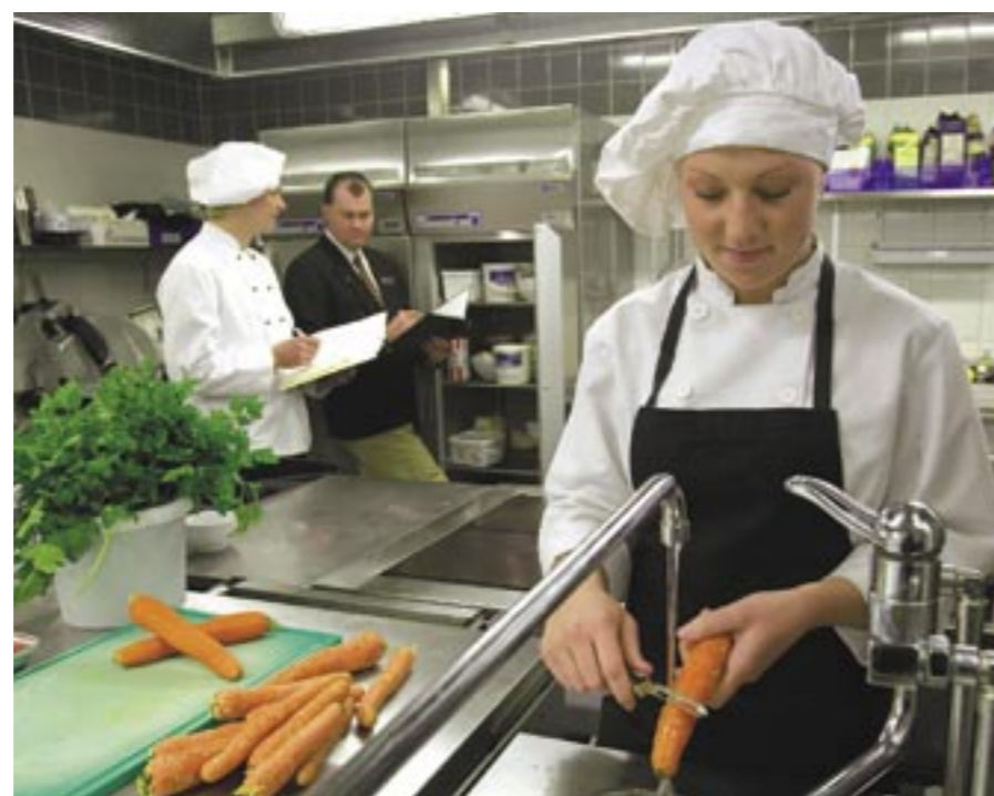
Många yrken inom livsmedelsindustrin tillhör riskgrupperna för handeksem och andra hudbesvär. Torr hud är en varningssignal – smörj in händerna med hudcreme, ofta!

Ett självklart råd är förstås att undvika kontakt med ämnen som är kända för att framkalla eksem. Det kan innebära att hantering av vissa livsmedel bör ske med handskar på. Använd i så fall plasthandskar (gummihandskar kan vara allergiframkallande). Bomullshandskar under plasthandskar minskar riskerna för hudproblem ytterligare.