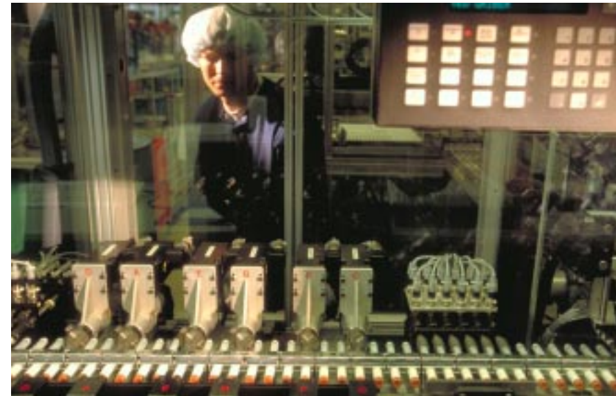
Insulinpenna, NovoLet, tillverkas under stränga hygienkrav på Novo Nordisks anläggning i Hilleröd, Danmark.

Novo Nordisk A/S – ett av Europas mest expansiva företag inom läkemedelsbranschen – väljer Sterisols hudvårdsprodukter till sin nyutbyggda fabrik i Hilleröd. Sedan tidigare finns Sterisols produkter hos de flesta av läkemedelsföretagets anläggningar i Danmark.